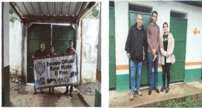
Foto1: .Vista con personal docente y presidente de OPF