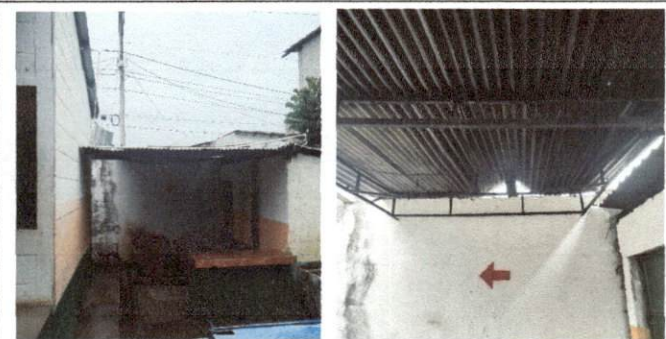
Foto 9: MODULO F de bodega, cambio de estructura de meta y lamina de zinc en mal estado.