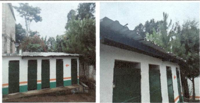
Foto 7: MODULO B Servicios sanitarios, cambio de lamina de zinc y costaneras de metal