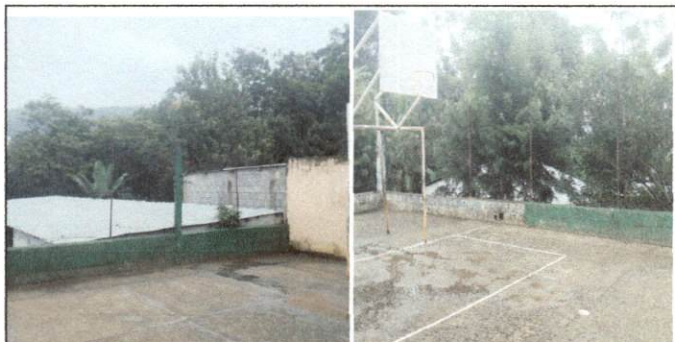
Foto 11: TRABAJOS EXTERIORES Reparacion de muro de block con malla metalica