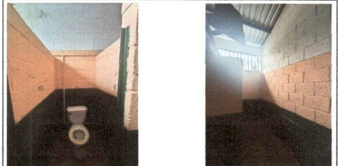
Foto 6: MODULO A SERVICIOS SANITARIOS Instalacion de piso ceramico sobre base de concreto, colocacion de azueljo en modulo de sanitarios.