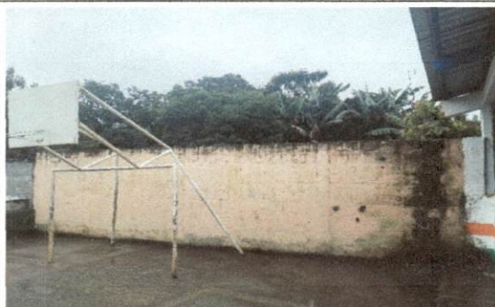
Foto 10: Sustitucion de Muro de block en mal estado, inestable y desplomado.