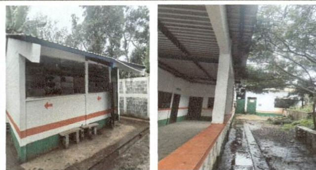
Foto 8: MODULO C de Aula Instalacion de canal de lamina galvanizada. MODULO D Instalacion de Canal galvanizado.