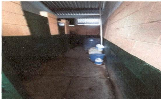
Foto 5: MODUL A Servicios Sanitarios colocar piso ceramico sobre base de concreto, azulejos en modulo de santarios